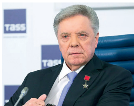
Борис ГРОМОВ, Герой Советского Союза, Председатель Всероссийской организации «БОЕВОЕ БРАТСТВО»