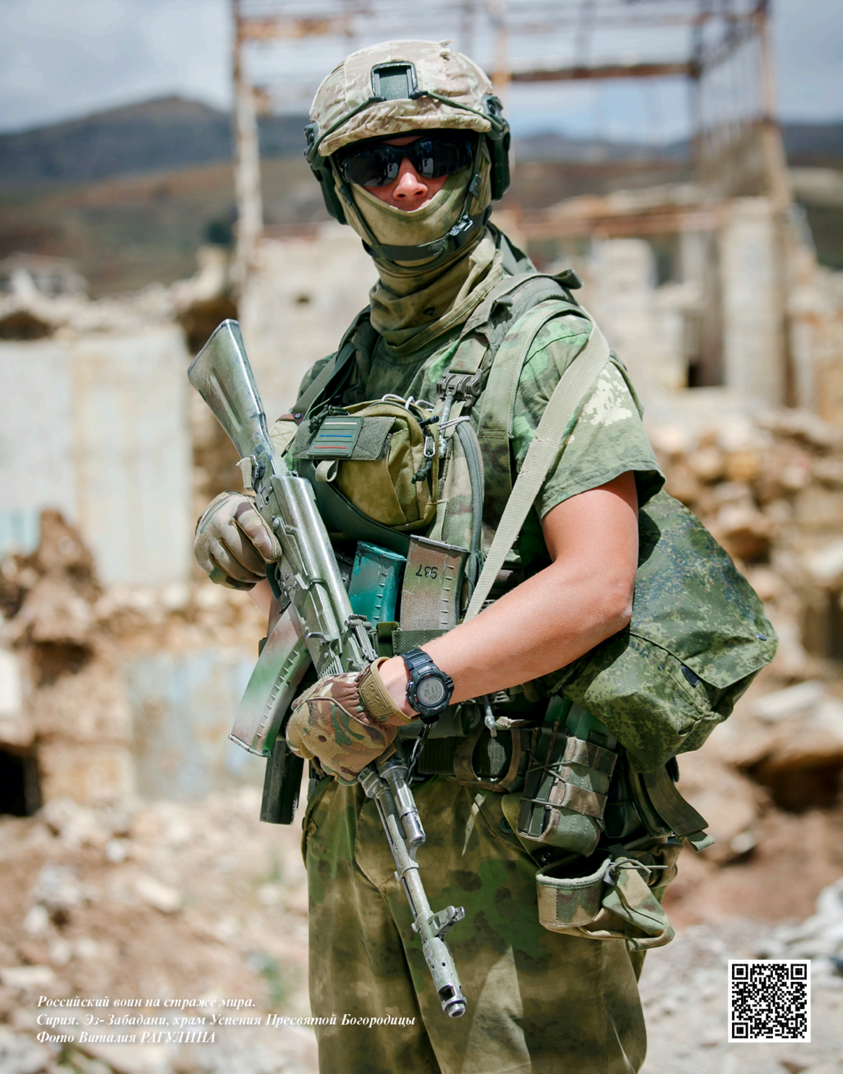
Российский воин на страже мира. Сирия. Эз-Забадани, храм Успения Пресвятой Богородицы