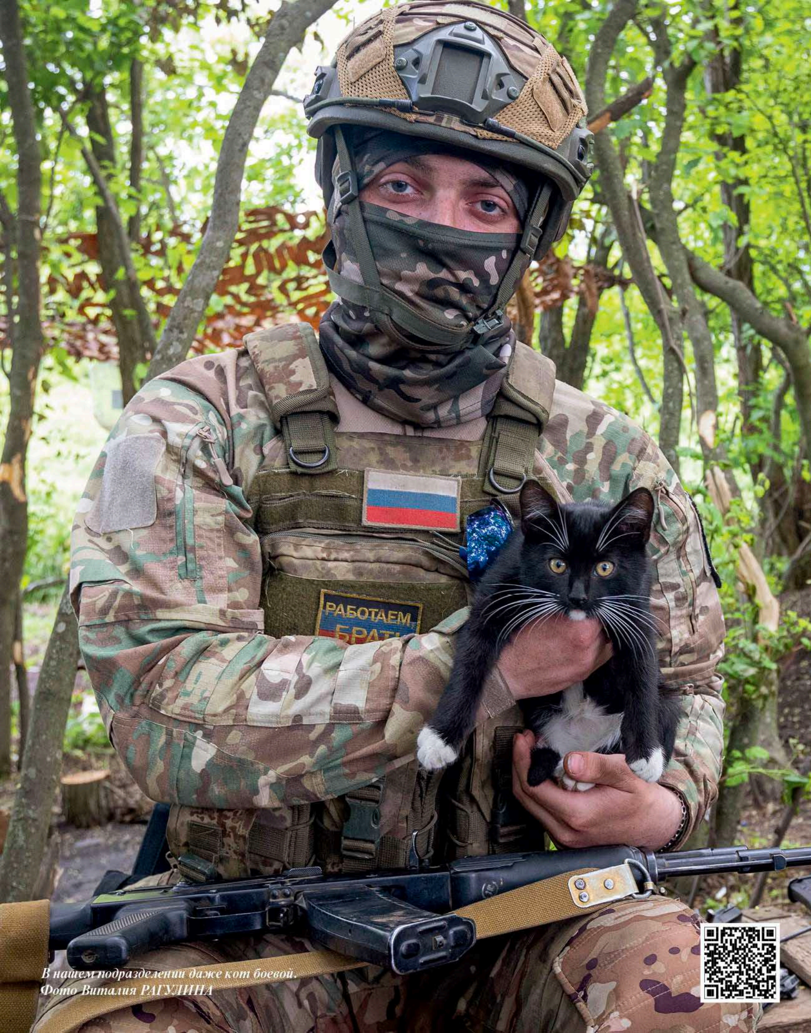
В нашем подразделении даже кот боевой.