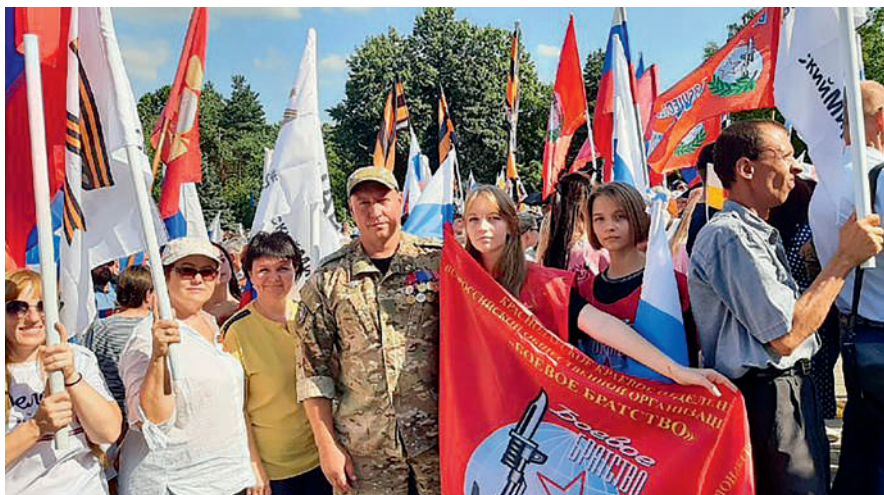
Митинг в поддержку СВО на Украине