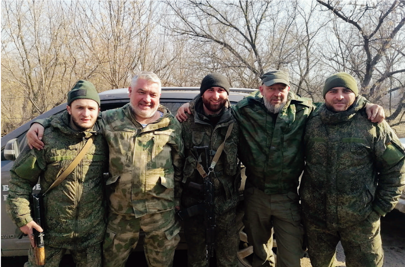
На снимке: Ахмат – сила! Бойцы из Чеченской Республики мужественно сражаются в Донбассе.

Один из выходов – подтянуть вросших в служебные кресла чиновников поближе к передовой. А пока, к сожалению, очень много драгоценного времени и сил уходит на поиск выходов из бюрократических лабиринтов. А ведь его можно потратить с большей пользой.