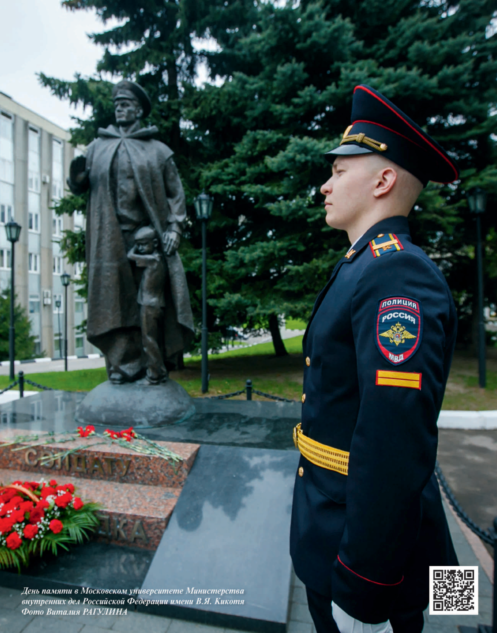
День памяти в Московском университете Министерства внутренних дел Российской Федерации имени В.Я. Кикотя