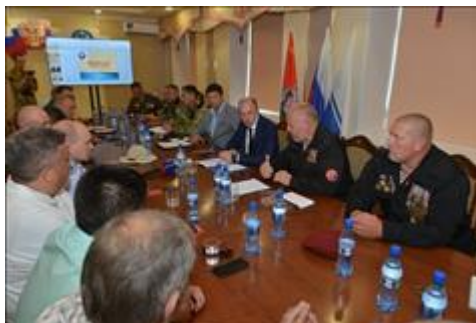
Правовой семинар для ветеранов боевых действий республики Алтай Организаторы и участники правового семинара