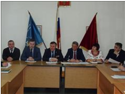
Правовой семинар в рамках форума отделений ВООБ "БОЕВОЕ БРАТСТВО" Уральского Федерального округа организаторы мероприятия