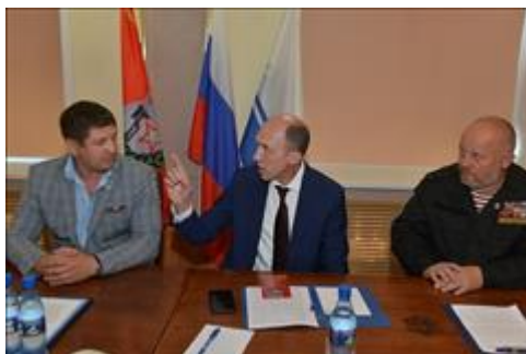
Правовой семинар для ветеранов боевых действий республики Алтай Органы государственной власти заинтересовались деятельность правового центра