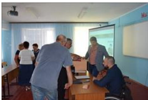
Правовой семинар для ветеранов боевых действий Ровеньского района Белгородской области Дискуссия по вопросам льгот продолжилась и после завершения семинара