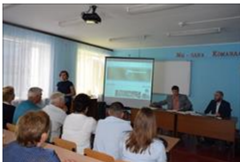
Правовой семинар для ветеранов боевых действий Ровеньского района Белгородской области Организаторы и участники правового семинара