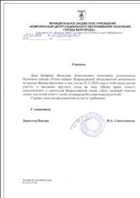
Правовой семинар в рамках круглого стола "Имею право знать" для детей-сирот Справка

Мероприятие: Итоговый круглый стол в г. Химки Московская область