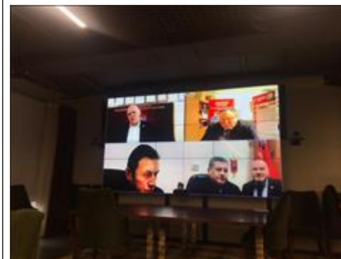
Итоговый круглый стол в г. Химки Московская область Руководители ветеранских организаций участвовали в круглом столе посредством online