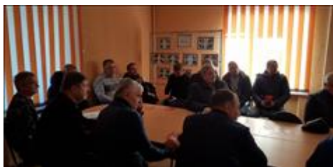
Правовой семинар с ветеранами и членами семей погибших Губкинского городского округа Белгородской об Участники семинара - ветераны боевых действий

Мероприятие: Правовой семинар с ветеранами и членами семей погибших Губкинского городского округа Белгородской области.