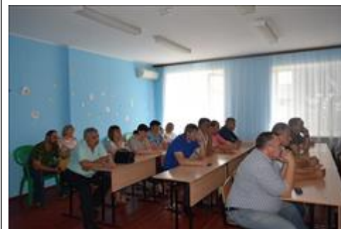
Правовой семинар для ветеранов боевых действий Ровеньского района Белгородской области Участники семинара - ветераны боевых действий, члены их семей, представители органов власти и местного самоуправления