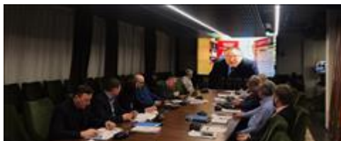
Итоговый круглый стол в г. Химки Московская область Online отчет о деятельности опорных точек правового центра в регионах