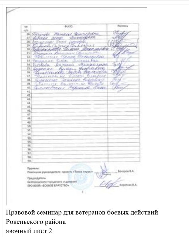
Правовой семинар для ветеранов боевых действий Ровенского района явочный лист 2