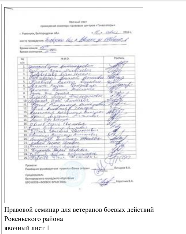
Правовой семинар для ветеранов боевых действий Ровенского района явочный лист 1