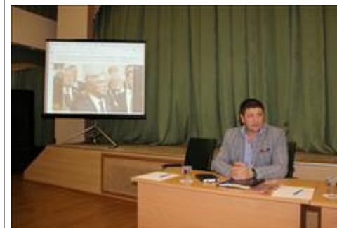
Правовой семинар с ветеранами и членами семей погибших Валуйского района Белгородской области. Руководитель правового центра доводит информацию по вопросам правового семинара