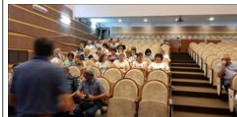
Правовой семинар для ветеранов боевых действий Чернянского района Белгородской области участники семинара - ветераны боевых действий и члены их семей