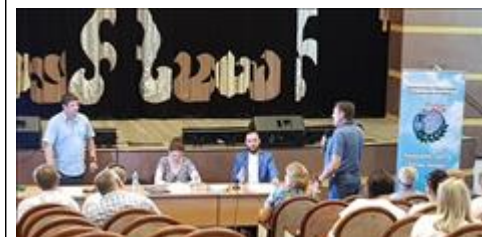
Правовой семинар для ветеранов боевых действий Чернянского района Белгородской области Ветераны задают интересующие их вопросы