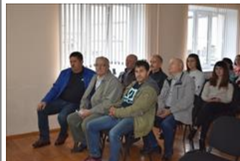
Правовой семинар с ветеранами боевых действий Алексеевского района Белгородской области Ветераны боевых действий и представители органов местного самоуправления