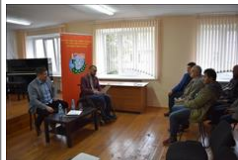
Правовой семинар с ветеранами боевых действий Алексеевского района Белгородской области Идет дискуссия между участниками и организаторами правового семинара