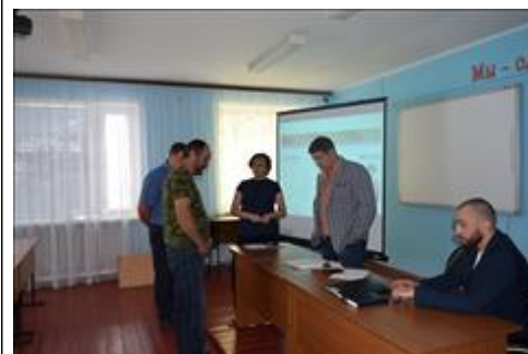
Правовой семинар для ветеранов боевых действий Ровеньского района Белгородской области Продолжение дискуссии