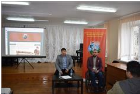
Правовой семинар с ветеранами боевых действий Алексеевского района Белгородской области Организаторы правового семинара