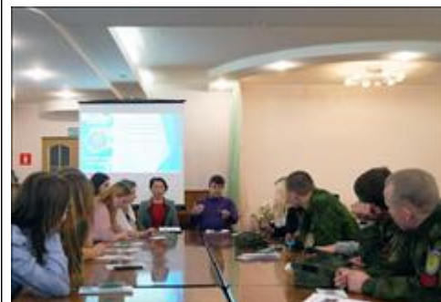
Правовой семинар в рамках круглого стола "Имею право знать" для детей-сирот Дети-сироты и дети оставшиеся без попечения родителей - участники семинара