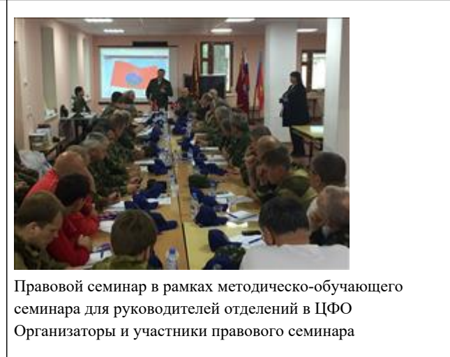
Правовой семинар в рамках методическо-обучающего семинара для руководителей отделений в ЦФО Организаторы и участники правового семинара