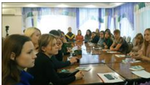
Правовой семинар в рамках круглого стола "Имею право знать" для детей-сирот Участники внимательно слушают о своих правах