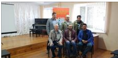
Правовой семинар с ветеранами боевых действий Алексеевского района Белгородской области Несколько поколений ветеранов боевых действий приняли участие в семинаре