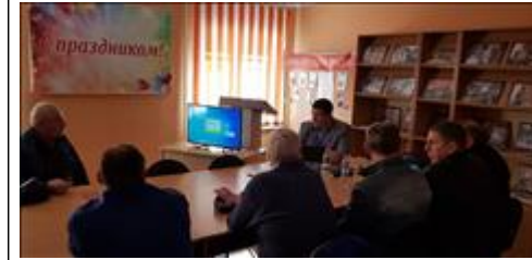
Правовой семинар с ветеранами и членами семей погибших Губкинского городского округа Традиционная дискуссия в конце правового семинара