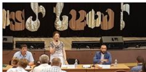
Правовой семинар для ветеранов боевых действий Чернянского района Белгородской области Организаторы правового семинара для ветеранов и членов их семей

Информация, указанная Вами в данном поле отчета, будет доступна для посетителей сайта Фонда президентских грантов (в том числе представителей СМИ)