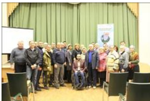
Правовой семинар с ветеранами и членами семей погибших Валуйского района Белгородской области. Общее фото по окончанию семинара

Первый лист проведение семинара правовым центром «Точка опоры» г. Валуйки Белгородская область *30.10.2023 г. место проведения: МКУС «Служба помощи гражданам» начало: 13.00 час. окончание: 17.00 час.