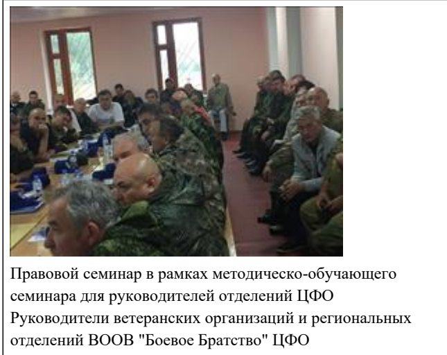
Правовой семинар в рамках методическо-обучающего семинара для руководителей отделений ЦФО Руководители ветеранских организаций и региональных отделений ВООВВ "Боевое Братство" ЦФО