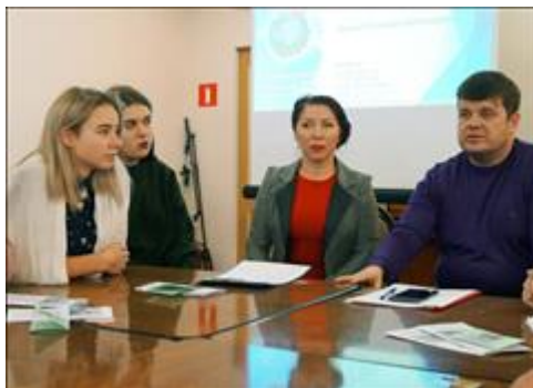
Правовой семинар в рамках круглого стола "Имею право знать" для детей-сирот Организаторы мероприятия