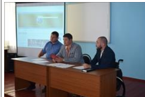
Правовой семинар для ветеранов боевых действий Ровеньского района Белгородской области Организаторы правового семинара