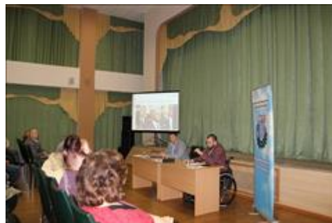
Правовой семинар с ветеранами и членами семей погибших Валуйского района Белгородской области. Организаторы и участники правового семинара