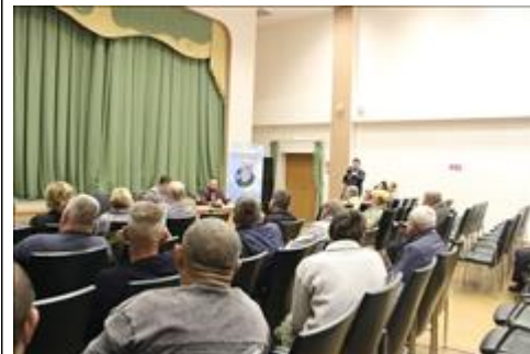
Правовой семинар с ветеранами и членами семей погибших Валуйского района Белгородской области. Учасники семинара слушают выступления организаторов правового семинара