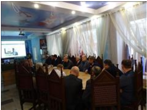
Правовой семинар в рамках форума отделений ВООБ "БОЕВОЕ БРАТСТВО" УФО Участники мероприятия