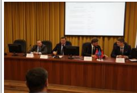
Правовой семинар для ветеранов боевых действий Вологодской области Дискуссия в президиуме по вопросам льгот и преференций