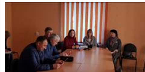
Правовой семинар с ветеранами и членами семей погибших Губкинского городского округа На правовом семинаре присутствовали и представители органов социальной защиты населения г. Губкин