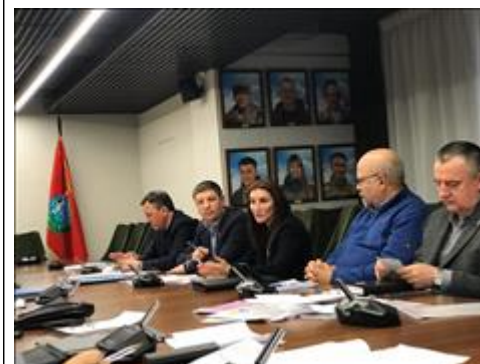
Итоговый круглый стол в г. Химки Московская область Дискуссия о перспективах деятельности правовых центров