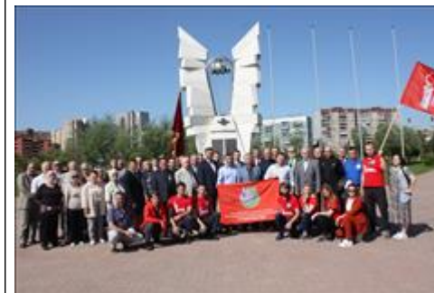
Правовой семинар в рамках учебно-методического сбора "БОЕВОГО БРАТСТВА" Участники мероприятия