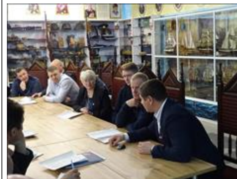
Правовой семинар в рамках форума отделений ВООВ "БОЕВОЕ БРАТСТВО" УФО Дискуссия...