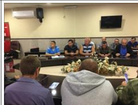
Проведение правового семинара в г. Боброве Юристы правового центра "Точка опоры Воронеж" проводят лекцию-семинар, юридическую консультацию в рамках проекта.