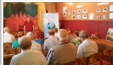
Проведение правового семинара в г. Богучар Юристы правового центра "Точка опоры Воронеж" проводят лекцию-семинар, юридическую консультацию в рамках