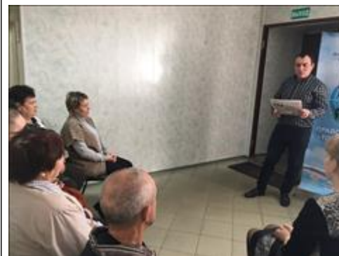
Проведение правового семинара в г. Борисоглебске Юристы правового центра "Точка опоры Воронеж" проводят лекцию-семинар, юридическую консультацию в рамках проекта.