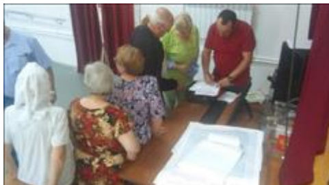
Оказание индивидуальной юридической помощи в городе Павловске Юристы правового центра "Точка опоры Воронеж" оказывают юридическую помощь в "Павловском госпитале для ветеранов" ветеранам ВОВ и труда.