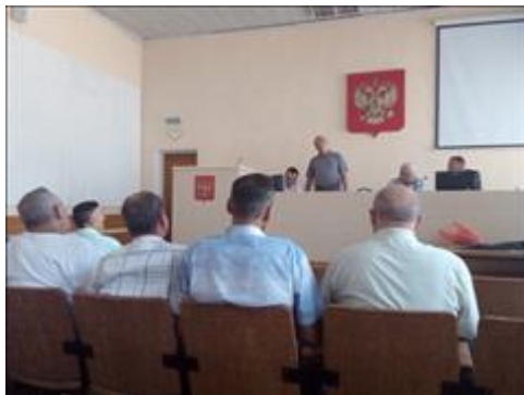
Проведение правового семинара в пгт Хохольский Юристы правового центра "Точка опоры Воронеж" проводят лекцию-семинар, юридическую консультацию в рамках проекта.