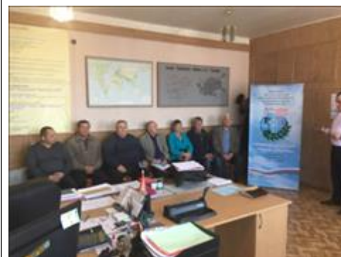
Проведение правового семинара в пгт Таловая Юристы правового центра "Точка опоры Воронеж" проводят лекцию-семинар, юридическую консультацию в рамках проекта.