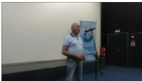
Проведение правового семинара в пгт Панино Юристы правового центра "Точка опоры Воронеж" проводят лекцию-семинар, юридическую консультацию в рамках проекта.