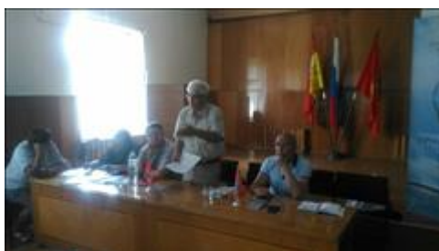
Проведение правового семинара в пгт Грибановский Юристы правового центра "Точка опоры Воронеж" проводят лекцию-семинар, юридическую консультацию в рамках проекта.