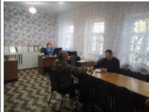
Проведение правового семинара в городе Павловске Юристы правового центра "Точка опоры Воронеж" проводят лекцию-семинар, юридическую консультацию в рамках проекта.