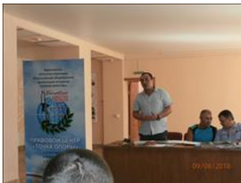
Проведение правового семинара в пгт Репьёвка Юристы правового центра "Точка опоры Воронеж" проводят