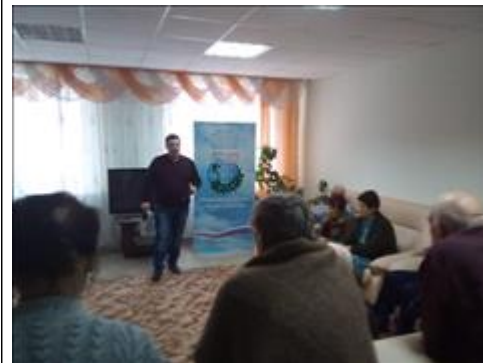
Проведение правового семинара в Павловском госпитале для ветеранов Юристы правового центра "Точка опоры Воронеж" проводят лекцию-семинар, юридическую консультацию в рамках проекта.