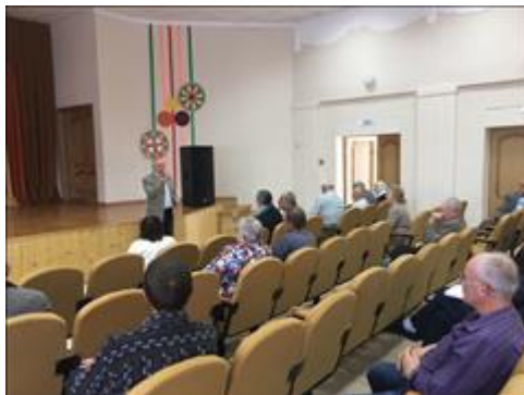
Проведение правового семинара в пгт Таловая Юристы правового центра "Точка опоры Воронеж" проводят лекцию-семинар, юридическую консультацию в рамках проекта.