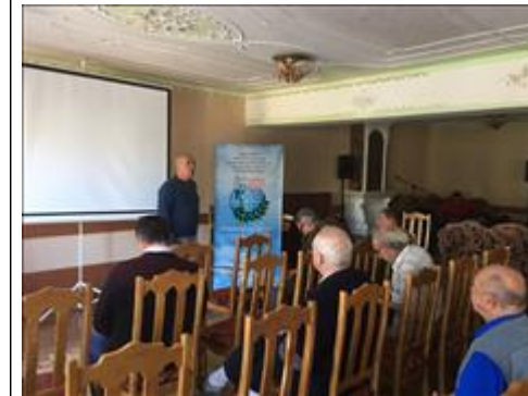
Проведение правового семинара в г. Лиски Юристы правового центра "Точка опоры Воронеж" проводят лекцию-семинар, юридическую консультацию в рамках проекта.