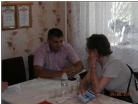
Оказание индивидуальной юридической помощи в городе Острогожске Юристы правового центра "Точка опоры Воронеж" оказывают юридическую помощь ветерану труда.