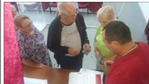
Оказание индивидуальной юридической помощи в городе Павловске Юристы правового центра "Точка опоры Воронеж" оказывают юридическую помощь в "Павловском госпитале для ветеранов" ветеранам ВОВ и и труда.