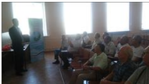
Проведение правового семинара в пгт Хохольский Юристы правового центра "Точка опоры Воронеж" проводят лекцию-семинар, юридическую консультацию в рамках проекта.