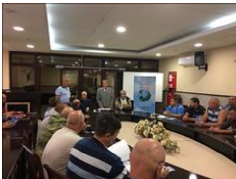
Круглый стол Заседание круглого стола