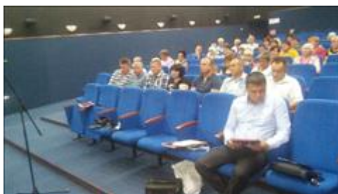
Проведение правового семинара в пгт Панино