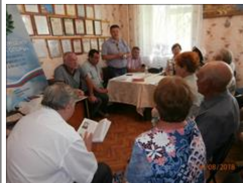
Проведение правового семинара в городе Острогожске Юристы правового центра "Точка опоры Воронеж" проводят лекцию-семинар, юридическую консультацию в рамках проекта.