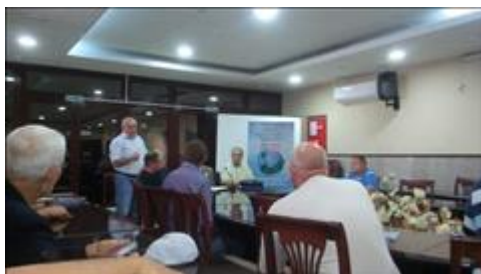
Проведение правового семинара в г. Боброве Юристы правового центра "Точка опоры Воронеж" проводят лекцию-семинар, юридическую консультацию в рамках проекта.