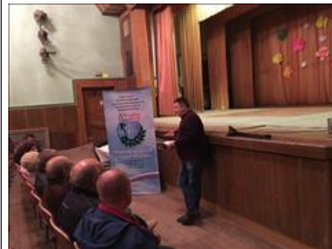
Проведение правового семинара в свхз Масловский Новоусманского района Юристы правового центра "Точка опоры Воронеж" проводят лекцию-семинар, юридическую консультацию в рамках проекта.