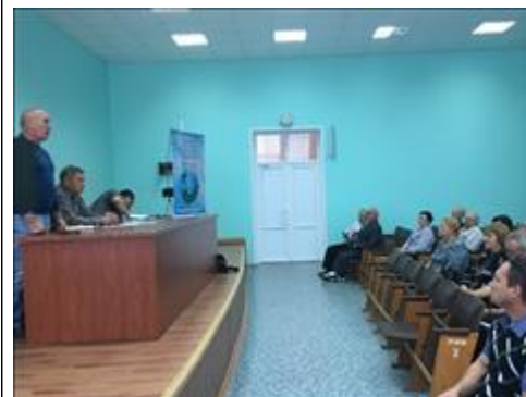
Проведение правового семинара в пгт Воробьёвка Юристы правового центра "Точка опоры Воронеж" проводят лекцию-семинар, юридическую консультацию в рамках проекта.