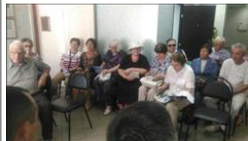
Проведение правового семинара в г. Борисоглебске Юристы правового центра "Точка опоры Воронеж" проводят лекцию-семинар, юридическую консультацию в рамках проекта.