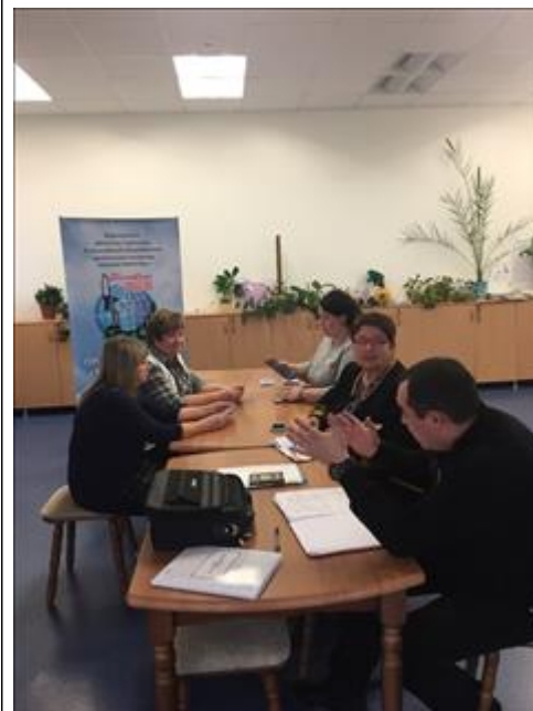
Проведение правового семинара в селе Хреновое Новоусманского района Юристы правового центра "Точка опоры Воронеж" проводят лекцию-семинар, юридическую консультацию в рамках проекта.