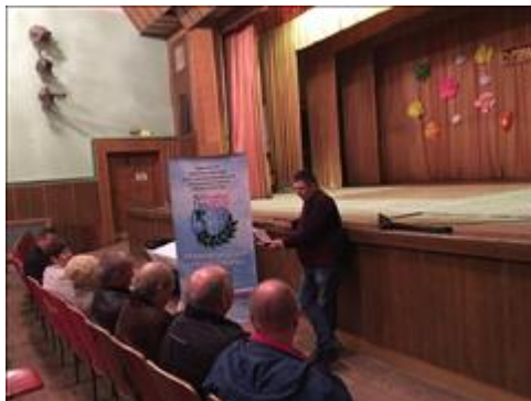
Проведение правового семинара в свхз Масловский Новоусманского района Юристы правового центра "Точка опоры Воронеж" проводят лекцию-семинар, юридическую консультацию в рамках проекта.