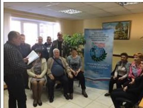
Проведение правового семинара в пгт Елань-Колено Юристы правового центра "Точка опоры Воронеж" проводят