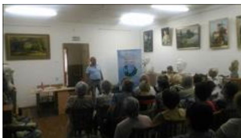
Проведение правового семинара в г. Эртиль Юристы правового центра "Точка опоры Воронеж" проводят лекцию-семинар, юридическую консультацию в рамках проекта.