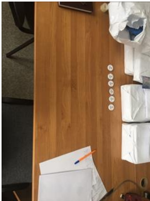
Стол письменный канцелярский Офис "Точка опоры Воронеж"