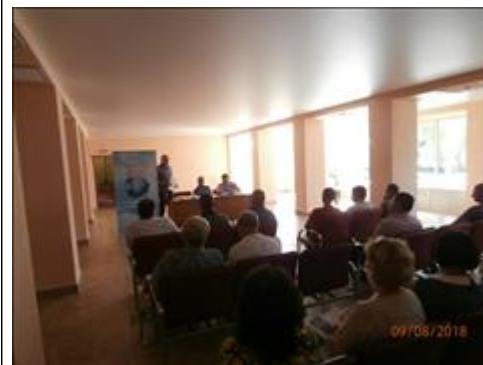
Проведение правового семинара в пгт Репьёвка Юристы правового центра "Точка опоры Воронеж" проводят