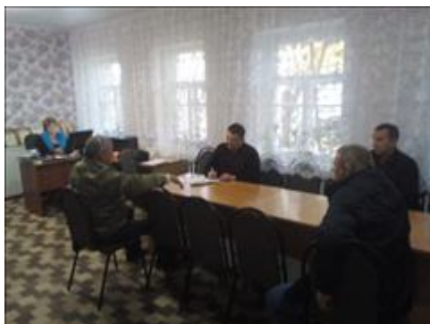
Проведение правового семинара в городе Павловске Юристы правового центра "Точка опоры Воронеж" проводят лекцию-семинар, юридическую консультацию в рамках проекта.