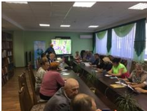
Проведение правового семинара в г. Кантемировка Юристы правового центра "Точка опоры Воронеж" проводят лекцию-семинар, юридическую консультацию в рамках проекта.