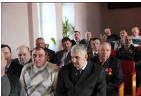
Проведение правового семинара в г. Калач Юристы правового центра "Точка опоры Воронеж" проводят лекцию-семинар, юридическую консультацию в рамках проекта.