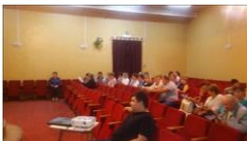
Проведение правового семинара в пгт Каширское Юристы правового центра "Точка опоры Воронеж" проводят лекцию-семинар, юридическую консультацию в рамках проекта.