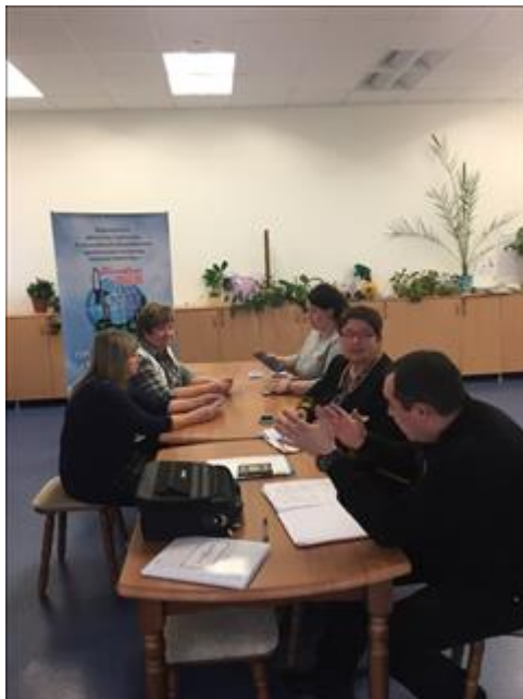
Оказание индивидуальной юридической помощи в селе Хреновое Новоусманского района Юристы правового центра "Точка опоры Воронеж" оказывают юридическую помощь ребёнку-инвалиду, учащемуся в начальной школе.

Электронные версии материалов (бюллетеней, брошюр, буклетов, газет, докладов, журналов, книг, презентаций, сборников и иных), созданных с использованием гранта в отчетном периоде (при условии, что такие материалы не содержатся в материалах, указанных в подпункте 5 настоящего пункта)