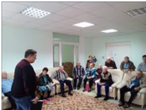
Проведение правового семинара в Павловском госпитале для ветеранов Юристы правового центра "Точка опоры Воронеж" проводят лекцию-семинар, юридическую консультацию в рамках проекта.