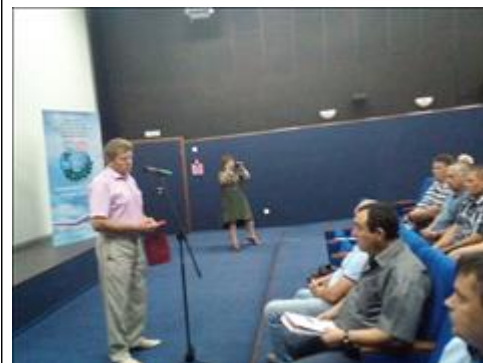
Проведение правового семинара в пгт Панино Юристы правового центра "Точка опоры Воронеж" проводят лекцию-семинар, юридическую консультацию в рамках проекта.