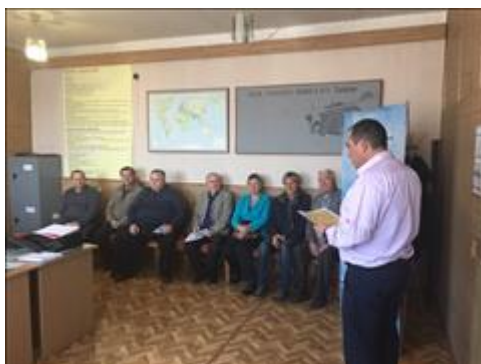
Проведение правового семинара в пгт Таловая Юристы правового центра "Точка опоры Воронеж" проводят лекцию-семинар, юридическую консультацию в рамках проекта.