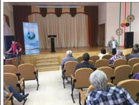
Проведение правового семинара в пгт Таловая Юристы правового центра "Точка опоры Воронеж" проводят лекцию-семинар, юридическую консультацию в рамках проекта.