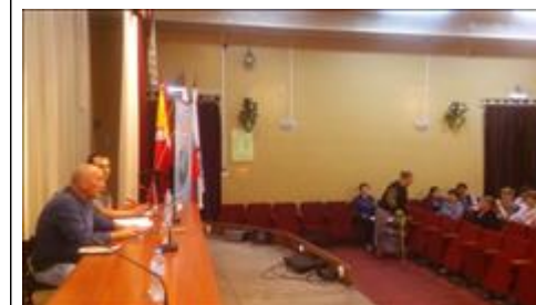
Проведение правового семинара в пгт Каширское Юристы правового центра "Точка опоры Воронеж" проводят лекцию-семинар, юридическую консультацию в рамках проекта.