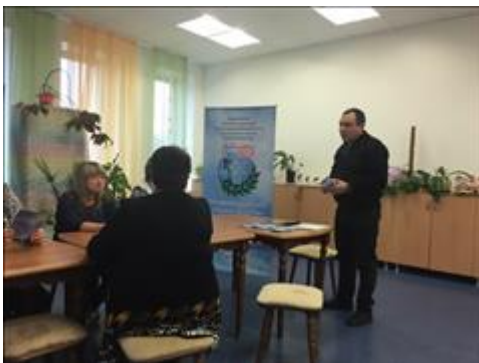
Проведение правового семинара в селе Хреновое Новоусманского района Юристы правового центра "Точка опоры Воронеж" проводят лекцию-семинар, юридическую консультацию в рамках проекта.