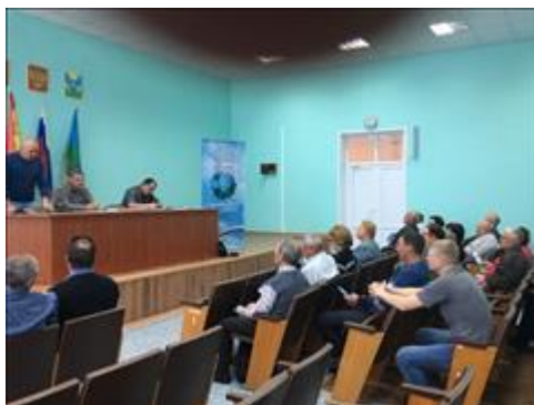
Проведение правового семинара в пгт Воробьёвка Юристы правового центра "Точка опоры Воронеж" проводят лекцию-семинар, юридическую консультацию в рамках проекта.