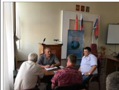
Проведение правового семинара в пгт Ольховатка Юристы правового центра "Точка опоры Воронеж" проводят лекцию-семинар, юридическую консультацию в рамках проекта.