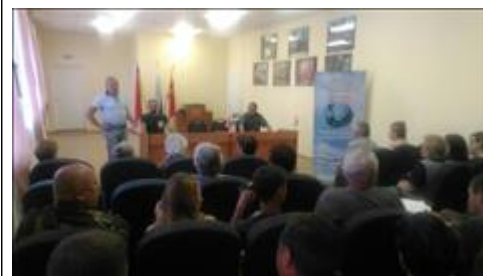
Проведение правового семинара в пгт Терновка Юристы правового центра "Точка опоры Воронеж" проводят