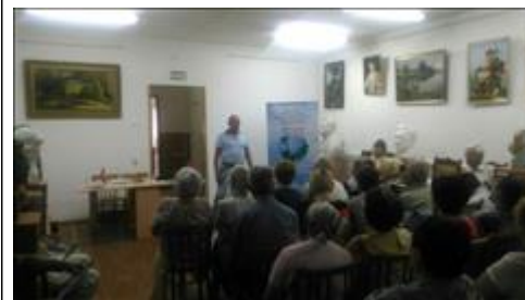
Проведение правового семинара в г. Эртиль Юристы правового центра "Точка опоры Воронеж" проводят лекцию-семинар, юридическую консультацию в рамках проекта.