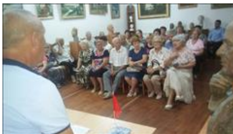
Проведение правового семинара в г. Эртиль Юристы правового центра "Точка опоры Воронеж" проводят лекцию-семинар, юридическую консультацию в рамках проекта.