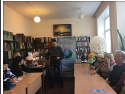
Проведение правового семинара в пгт Каширское Юристы правового центра "Точка опоры Воронеж" проводят лекцию-семинар, юридическую консультацию в рамках проекта.