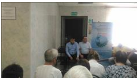
Проведение правового семинара в г. Борисоглебске Юристы правового центра "Точка опоры Воронеж" проводят лекцию-семинар, юридическую консультацию в рамках проекта.