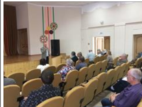
Проведение правового семинара в пгт Таловая Юристы правового центра "Точка опоры Воронеж" проводят лекцию-семинар, юридическую консультацию в рамках проекта.