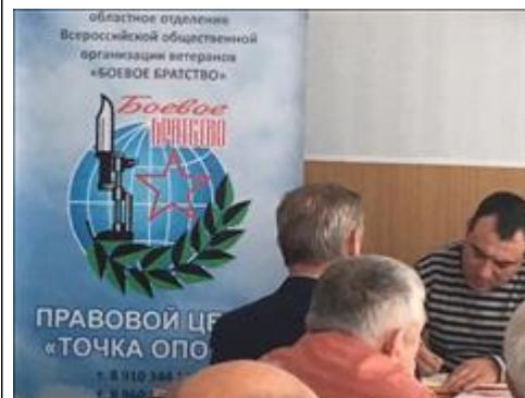
Оказание индивидуальной юридической помощи в пгт Подгоренский Юристы правового центра "Точка опоры Воронеж" оказывают юридическую помощь ветерану боевых действий в ДРА.