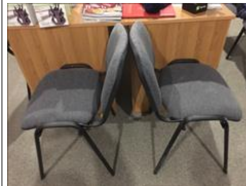
Стул офисный Офис "Точка опоры Воронеж"