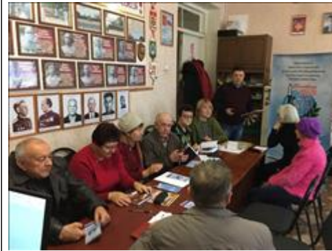
Проведение правового семинара в г. Кантемировка Юристы правового центра "Точка опоры Воронеж" проводят лекцию-семинар, юридическую консультацию в рамках проекта.