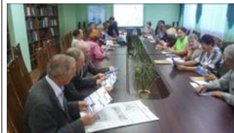
Круглый стол Заседание круглого стола