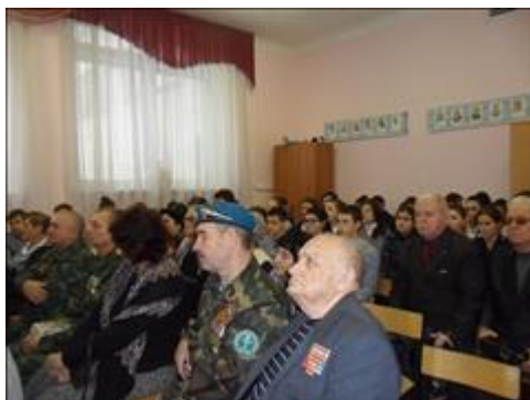
Проведение правового семинара в свхз Масловский Новоусманского района Юристы правового центра "Точка опоры Воронеж" проводят лекцию-семинар, юридическую консультацию в рамках проекта.