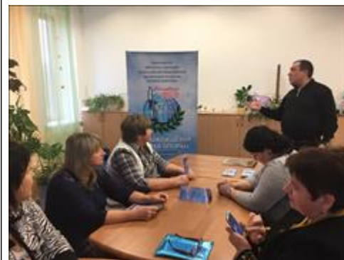
Проведение правового семинара в селе Хреновое Новоусманского района Юристы правового центра "Точка опоры Воронеж" проводят лекцию-семинар, юридическую консультацию в рамках проекта.