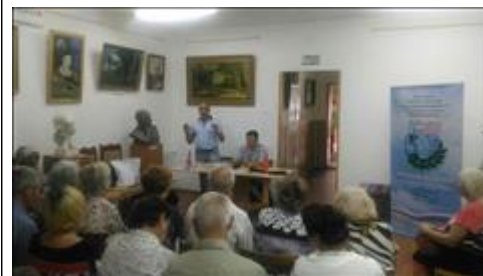
Проведение правового семинара в г. Эртиль Юристы правового центра "Точка опоры Воронеж" проводят лекцию-семинар, юридическую консультацию в рамках проекта.