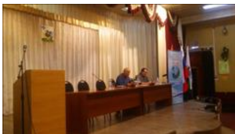
Проведение правового семинара в пгт Каширское Юристы правового центра "Точка опоры Воронеж" проводят лекцию-семинар, юридическую консультацию в рамках проекта.