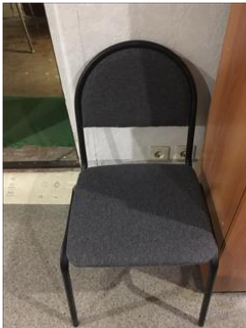
Стул офисный Офис "Точка опоры Воронеж"