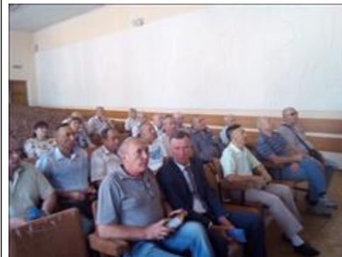
Проведение правового семинара в пгт Хохольский Юристы правового центра "Точка опоры Воронеж" проводят лекцию-семинар, юридическую консультацию в рамках проекта.