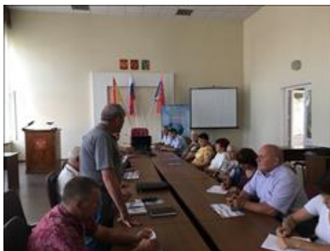
Проведение правового семинара в пгт Ольховатка Юристы правового центра "Точка опоры Воронеж" проводят лекцию-семинар, юридическую консультацию в рамках проекта.