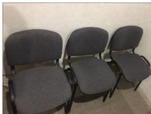
Стул офисный Офис "Точка опоры Воронеж"