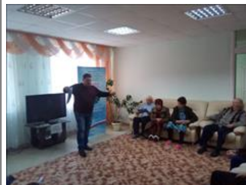
Проведение правового семинара в Павловском госпитале для ветеранов Юристы правового центра "Точка опоры Воронеж" проводят лекцию-семинар, юридическую консультацию в рамках проекта.