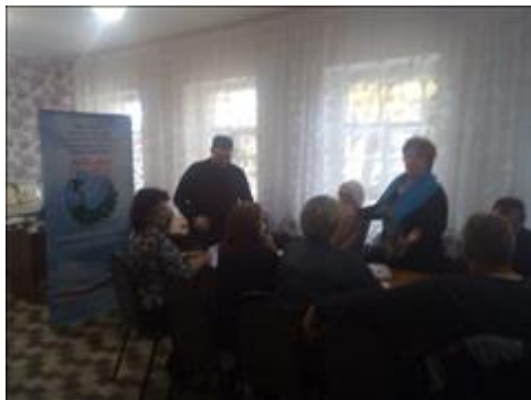
Проведение правового семинара в городе Павловске Юристы правового центра "Точка опоры Воронеж" проводят лекцию-семинар, юридическую консультацию в рамках проекта.