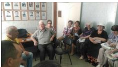
Проведение правового семинара в г. Борисоглебске Юристы правового центра "Точка опоры Воронеж" проводят лекцию-семинар, юридическую консультацию в рамках проекта.