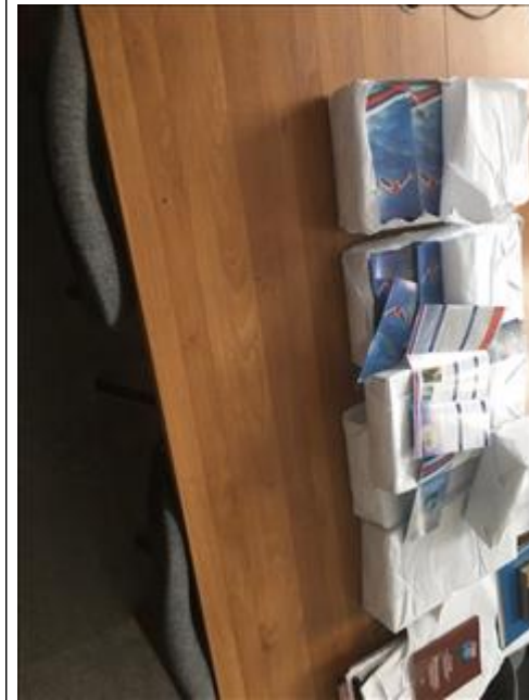
Стол письменный канцелярский Офис "Точка опоры Воронеж"