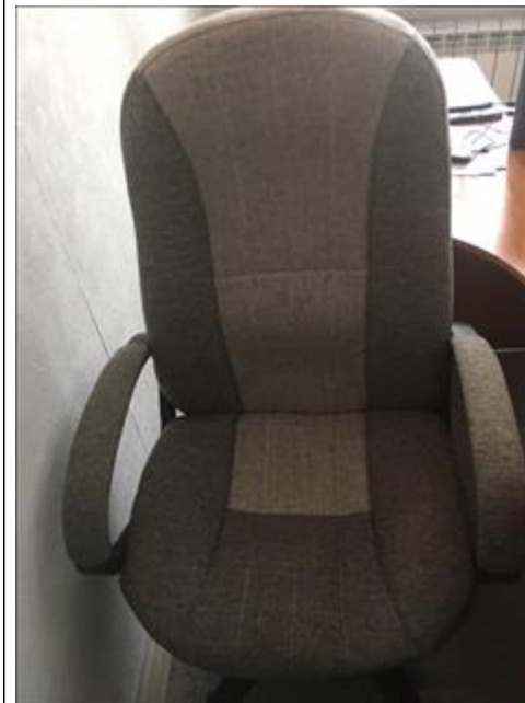
Кресло офисное Офис "Точка опоры Воронеж"