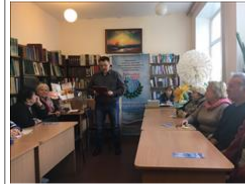
Проведение правового семинара в пгт Каширское Юристы правового центра "Точка опоры Воронеж" проводят лекцию-семинар, юридическую консультацию в рамках проекта.