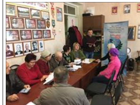
Проведение правового семинара в г. Кантемировка Юристы правового центра "Точка опоры Воронеж" проводят лекцию-семинар, юридическую консультацию в рамках проекта.