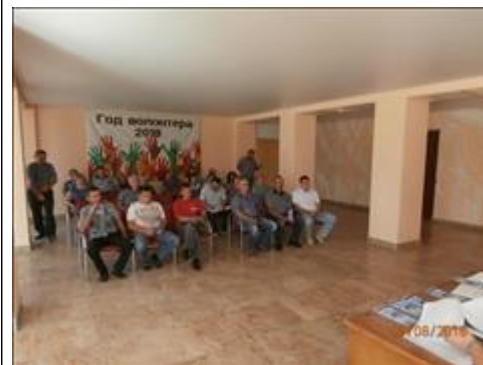
Проведение правового семинара в пгт Репьёвка Юристы правового центра "Точка опоры Воронеж" проводят лекцию-семинар, юридическую консультацию в рамках проекта.