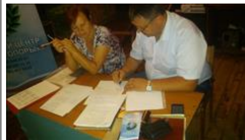
Оказание индивидуальной юридической помощи в селе