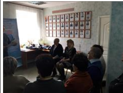
Проведение правового семинара в г. Борисоглебске Юристы правового центра "Точка опоры Воронеж" проводят