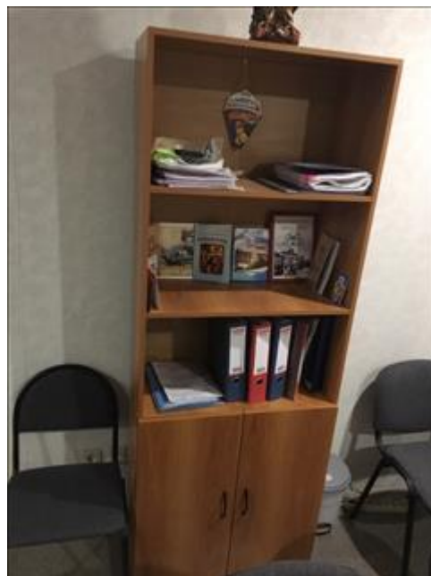
Шкаф канцелярский Офис "Точка опоры Воронеж"

Информация, указанная Вами в данном поле отчета, будет доступна для посетителей сайта Фонда президентских грантов (в том числе представителей СМИ)