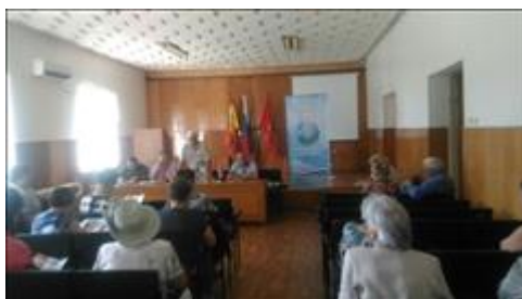
Проведение правового семинара в пгт Грибановский Юристы правового центра "Точка опоры Воронеж" проводят лекцию-семинар, юридическую консультацию в рамках проекта.