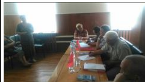
Проведение правового семинара в пгт Грибановский Юристы правового центра "Точка опоры Воронеж" проводят лекцию-семинар, юридическую консультацию в рамках проекта.