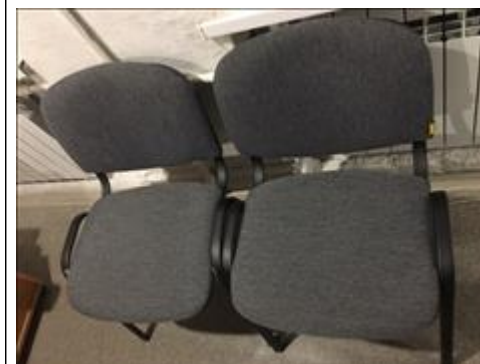
Стул офисный Офис "Точка опоры Воронеж"