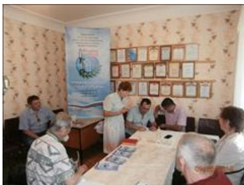
Проведение правового семинара в городе Острогожске Юристы правового центра "Точка опоры Воронеж" проводят лекцию-семинар, юридическую консультацию в рамках проекта.