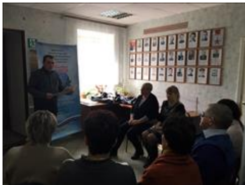
Проведение правового семинара в г. Борисоглебске Юристы правового центра "Точка опоры Воронеж" проводят