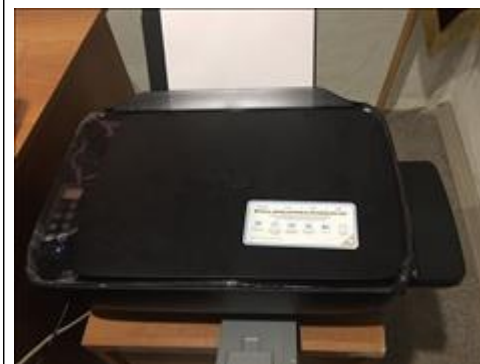
Многофункциональное устройство HP Deskjet GT 5820 цветной Офис "Точка опоры Воронеж"